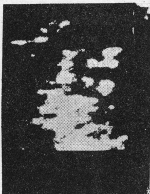
Fig. 3 shows the grey-scale image of scanning tunneling microscope of the same region as fig 2. This is a two-dimensional plot. The bright part shows the head group which is higher than the plane of liposome membrane and the dark between the bright parts in which the PC head is lower than plane of liposomes.

图3显示PC卵磷脂双层膜表面的灰度像,其与图2的线扫描像相对应。发亮的部位表示凸出膜表面有一定高度,在亮部位之间的暗区表示低于膜表面凹下一定深度。从图中看出PC磷脂头部的分布是不均匀的。